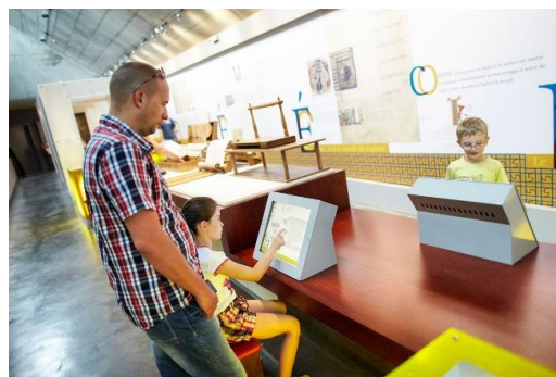
L'histoire des manuscrits