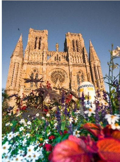
L'église Notre-Dame-des Champs