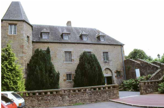
L'entrée du Musée

Ce musée informe sur la Seconde Guerre Mondiale.