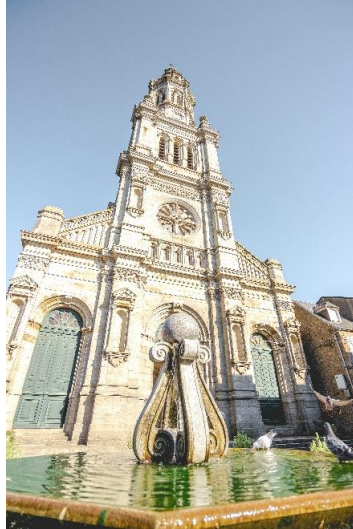
La Basilique Saint-Gervais