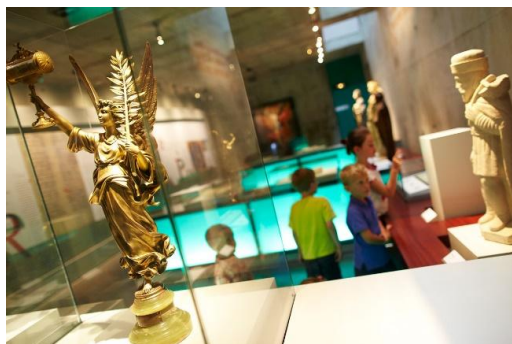
L'histoire du Mont Saint-Michel