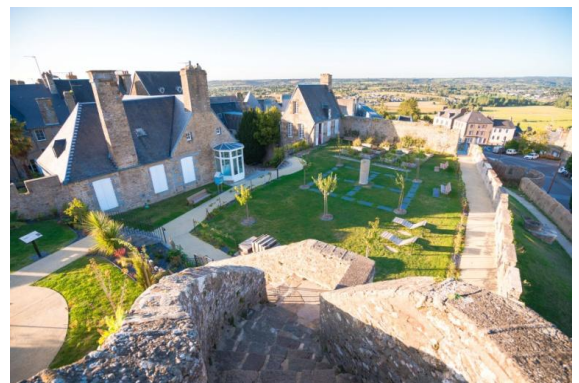
Le jardin du château