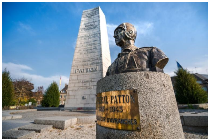
Statue du Général Patton

Une statue du Général Patton se trouve Place Patton.