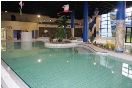
S'amuser à la piscine