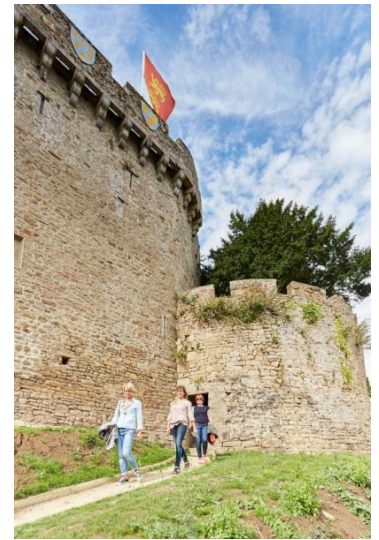
Le donjon du château

Depuis le jardin du château il y a une belle vue sur la ville.