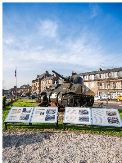
Le char d'assaut

Ce char d'assaut a servi pendant la Seconde Guerre Mondiale.