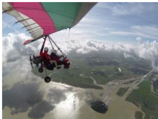
Faire de l'ULM

💻 Site Internet : www.ulm-mont-saint-michel.com