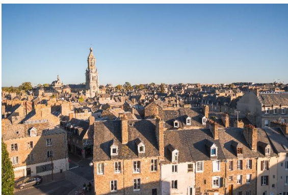
Vue sur la ville depuis le jardin du château