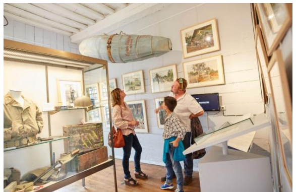
Objets de la Seconde Guerre Mondiale