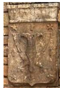
Escudo frente al colegio

Este escudo “de plata con un águila desplegada de sable, con un jefe de gules cargado con cuatro estrellas y cuatro manos, todo de oro alternadas” estuvo en uso de 1944 a 1959. Puede verse en la entrada del Colegio Jules Verne.