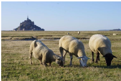
Les 2 types de moutons