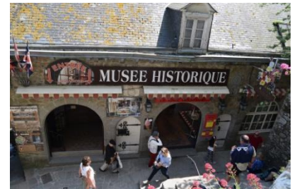
Le Musée Historique