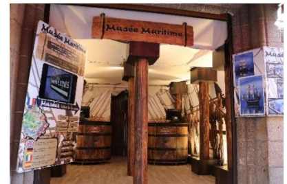
Le Musée de la mer