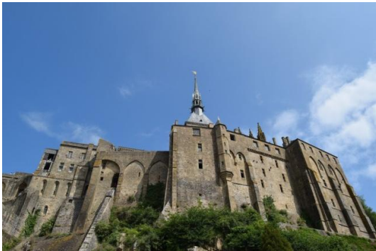
Vue sur l'abbaye

Depuis les jardins il y a une jolie vue sur l'abbaye et la baie.