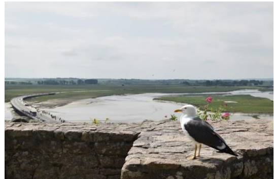
Vue sur la baie