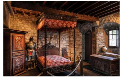
Le Logis Tiphaine

On visite une ancienne maison qui a été habitée par un chevalier.