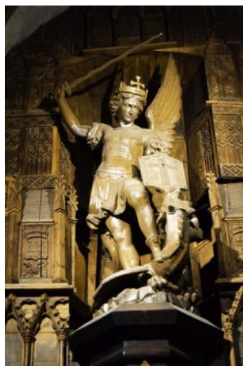
La statue de l'Archange Saint-Michel