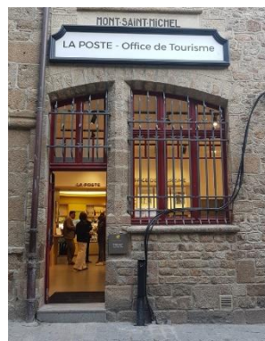
L'Office de tourisme du Mont Saint-Michel

💻 Site Internet : www.ot-montsaintmichel.com