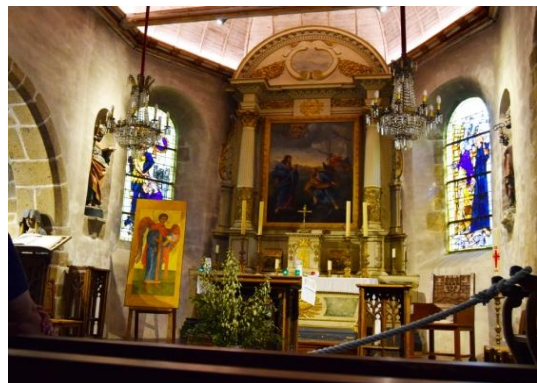
L'intérieur de l'église