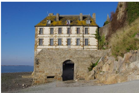
Entrée des Fanils

Pour connaître les tarifs d'entrée et conditions de gratuité pour la visite de l'abbaye consultez le site internet : www.abbaye-mont-saint-michel.fr