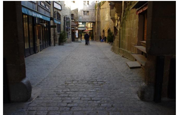
Rue principale du village