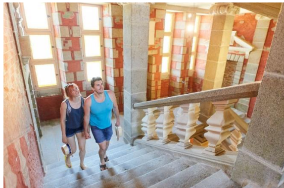
L'intérieur du château