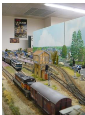
Maquettes de trains miniatures