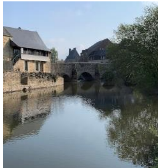
Le vieux pont