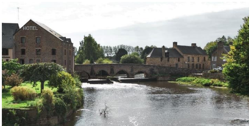
Le vieux pont

Le vieux pont est dans le centre de Ducey.