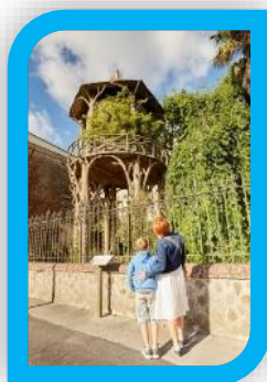
6 La citerne à eau