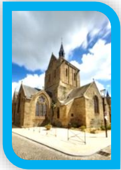
2 L'église Notre-Dame