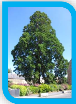
5 Un vieil arbre