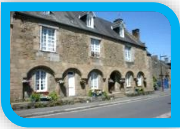
1 La maison romane