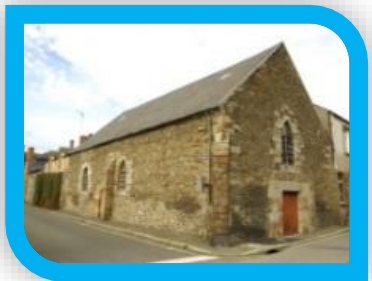
3 Le Prêche protestant