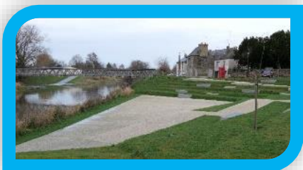
4 Le jardin public