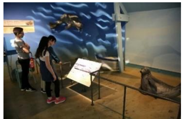
Maquette de phoque