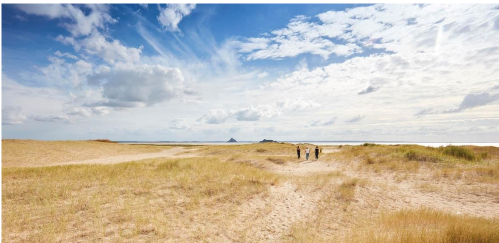
La plage du Bec d'Andaine