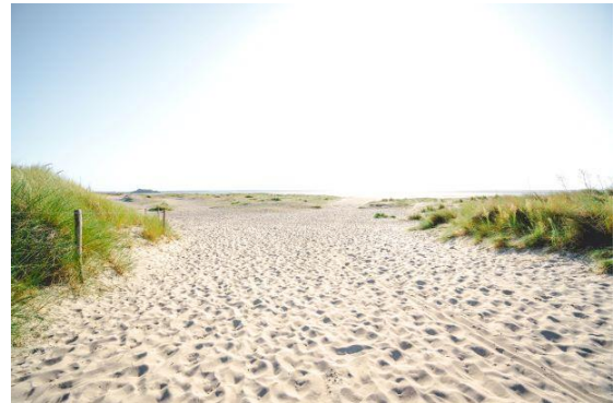
La plage du Bec d'Andaine