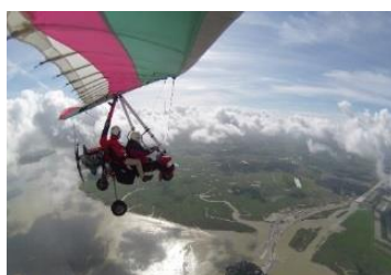
Survoler la Baie en ULM

💻 Site internet : www.ulm-mont-saint-michel.com