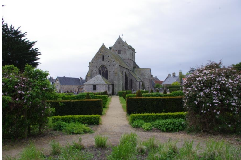
Les jardins derrière l'église