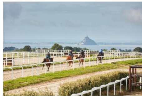
Les chevaux s'entraînent pour les compétitions

Le Centre équestre se situe à 4 kilomètres de Genêts.