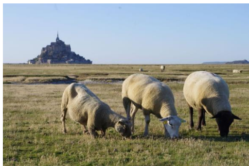
Les 2 types de moutons