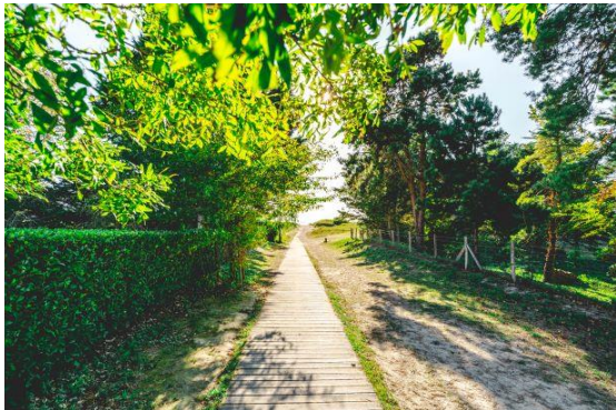
Ce chemin mène à la plage

C'est agréable de s'y promener, surtout le soir.