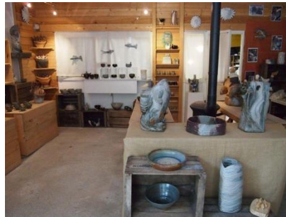
Les poteries et sculptures