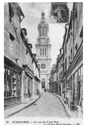
45 AVRANCHES. — La rue des 3 rois Rois et l'Eglise Saint Gervais. — 2010

L'église Saint-Gervais possède 32 cloches dont « Marie d'Avranches » qui provient de l'ancienne cathédrale, et le bourdon « Saint-Aubert » qui pèse près de 7 tonnes. Le carillon de 23 cloches est reconnu pour son excellente sonorité.