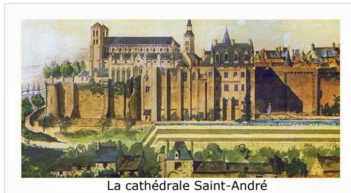
La cathédrale Saint-André

En très mauvais état au 18 ème siècle, elle s'effondra une nuit d'avril 1794 à la suite de travaux malheureux. Il n'y eut d'autre choix que d'araser la cathédrale.